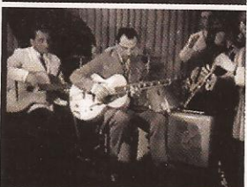
Au festival de Nice en février 1948, avec une guitare électrique suisse Rio.